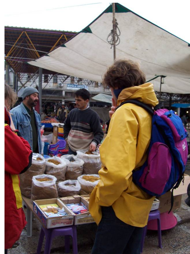
On goûte également le tabac

Dans le non alimentaire, outre la vaisselle, les fourneaux pour l'hiver, on trouve une multitude de stands textiles. Là, de Hugo Boss à Rica Lewis, de Lacoste à Naf-Naf, on peut