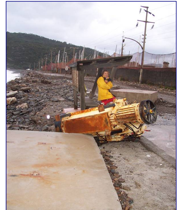
Le vieux moteur de cargo ne s'en est pas remis !