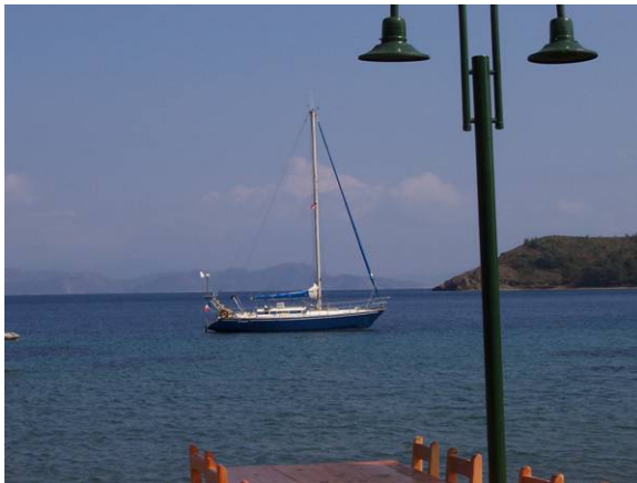
Küprüca-Bükü – mai 04