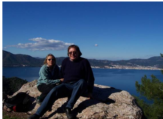
Baie de Marmaris – janvier 03 C'est-y pas beau, la Turquie ?