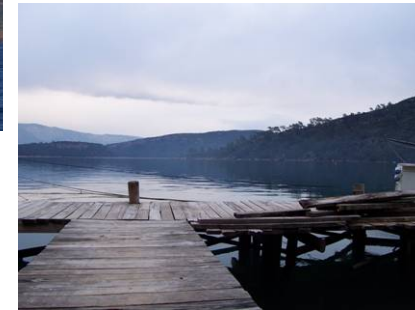
Karaça-Sogüt – janvier 03