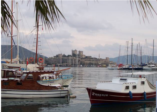
Bodrum – Janvier 04

Quelques endroits que nous avons particulièrement aimés :