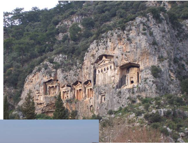
Tombes Lyciennes sculptées à même la falaise. Vème siècle Caunus – février 03