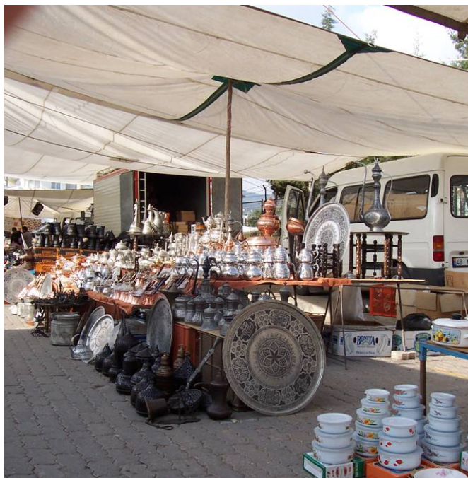
La profusion de vaisselle