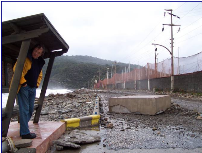
Bloc de béton projeté sur la route (hiver 2003-2004)

Même dans les rares éclaircies, il était illusoire de sortir en mer, les coups de vent étant beaucoup trop rapprochés. Nous avons dû attendre jusqu'au début Mai pour pouvoir repartir en sécurité...